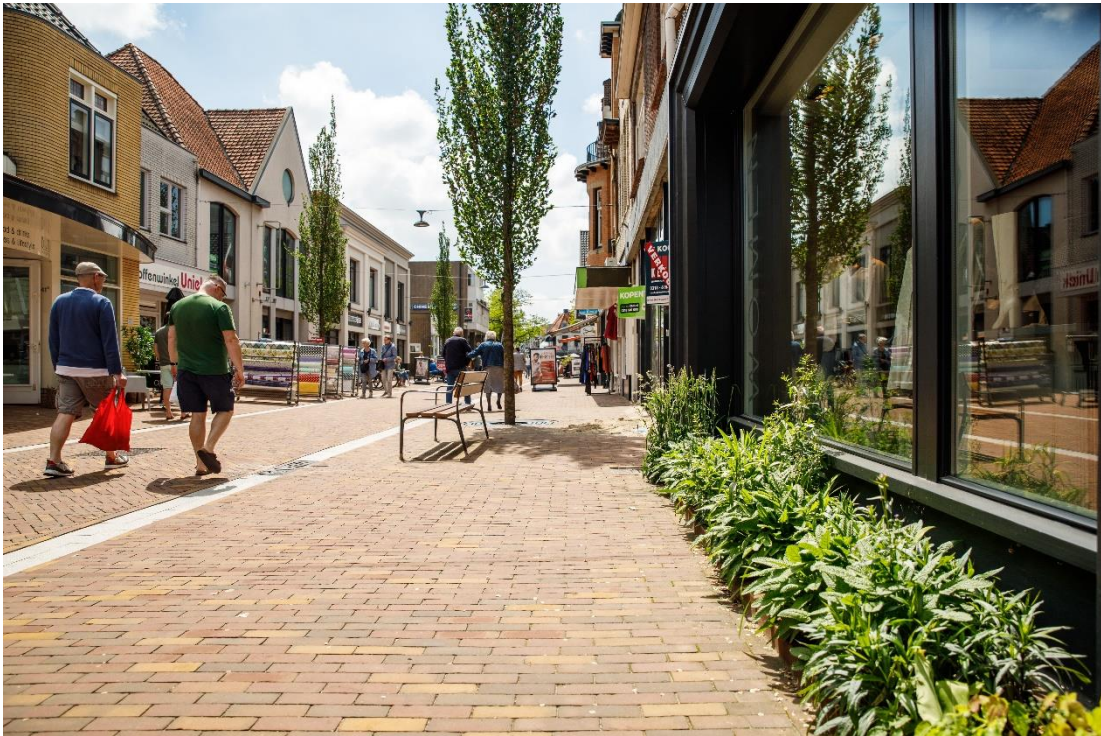
Impressie van de Grotestraat in Ede, een van de straten die in het onderzoeksproject werd onderzocht en waar de gemeente met eigenaren inzet op vergroening.